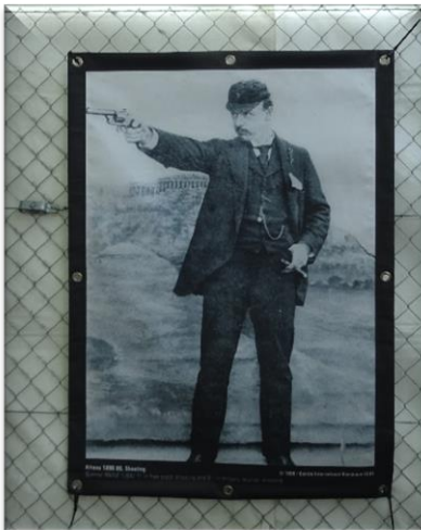
Beachte die Zigarre in der linken Hand

Imposante Plakate zum Thema Schiessen «früher» konnte im Ganzen Areal bestaunt werden.